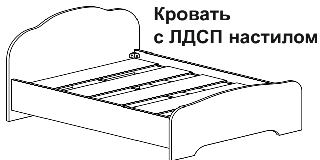
Кровать с ЛДСП настилом

Габаритные размеры 1270 / 1470 / 1670 x 900 x 2050 Короб ЛДСП, фасад МДФ / ЛМДФ