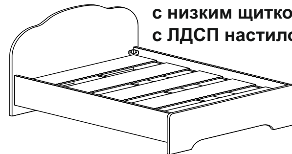
Кровать с низким щитком с ЛДСП настилом